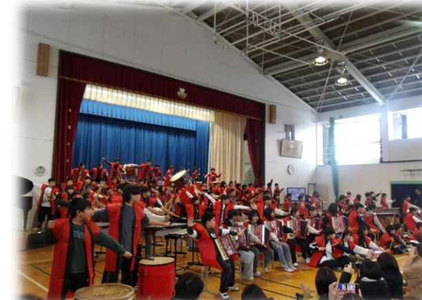
【6年生「炎の YAGI-BUSHI」 他】