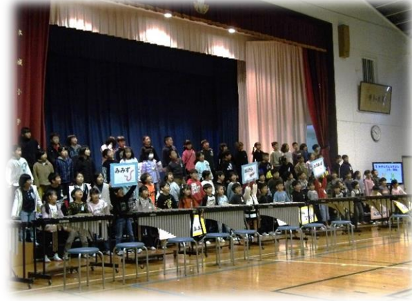
【2年生「生きものとなかよし」】